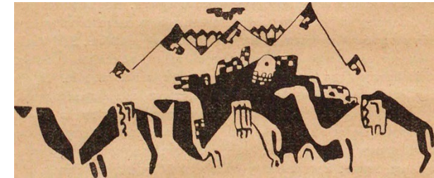
Frühe sowjetische Mobilitätsnarrative