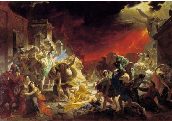
Natur und Katastrophe