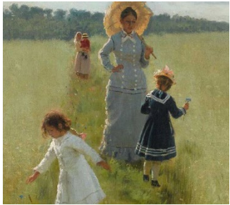
MUSEUM BARBERINI POTSDAM